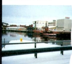
DE HAVEN WAARAAN DORA 1 LIGT