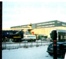
VOORMALIGE ONDERZEEBOTENBASIS DORA 1, WAAR MOTORPSYCHO REPERTOERT