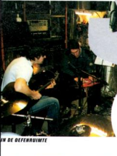
IN DE OEFENRUIMTE