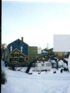
HET HUIS NAAST DE AUTOGARAGE. TOONBEELD VAN HET CONFLICT TUSSEN SVARTLAMON EN DE GEVESTIGDE ORDE

'De reacties zijn heel divers. Het ligt er maar aan hoe lang en hoe goed je ons hebt gevolgd. Wie alleen het live-album en Trust Us kent, zal verrast zijn. Wie al wat langer meegaat, zal dingen herkennen. Motorpsycho heeft sinds